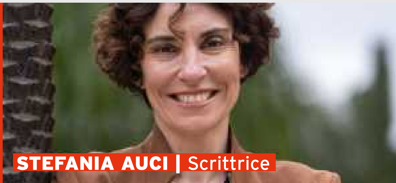
STEFANIA AUCI | Scrittrice