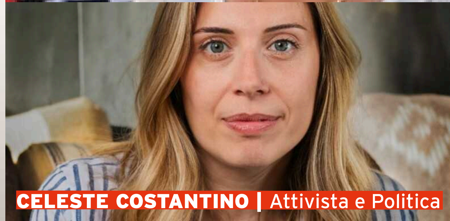
CELESTE COSTANTINO | Attivista e Politica