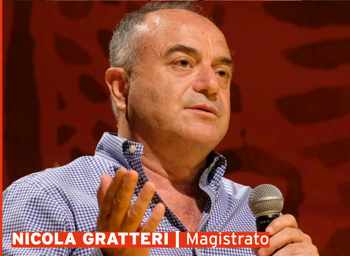
NICOLA GRATTERI | Magistrato